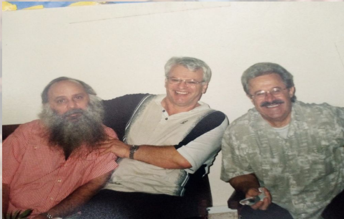
Don Natalino Parodi & C.